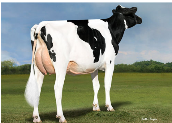
REGAN-DANHOF JEDI CASHMERE DAM