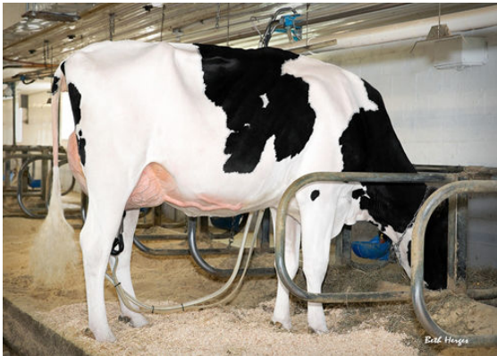
REGAN-DANHOF JEDI CASHMERE DAM