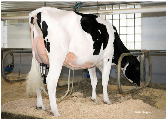
REGAN-DANHOF JEDI CASHMERE DAM